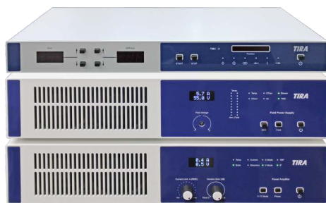
Nulllageregelung, Feldversorgung und Verstärker