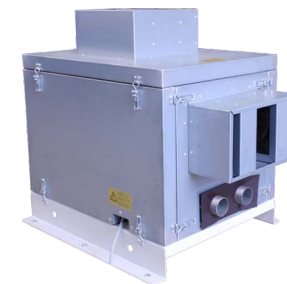
Schallschutzkammer TB 0140-AE (optional)