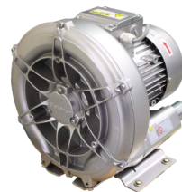
Kühlgebläse TB 0140