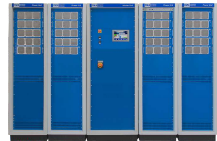
Verstärker (Abb. ähnlich)